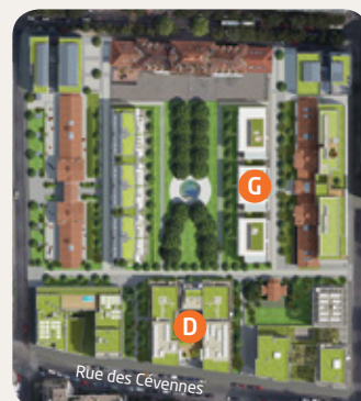
Rue des Cévennes