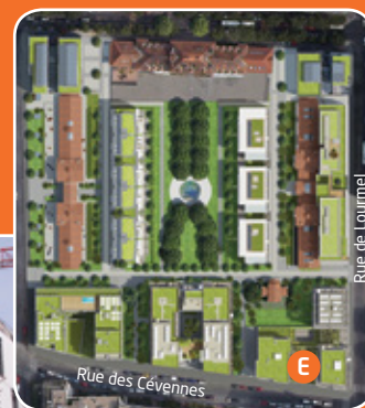
Rue de Lourmel