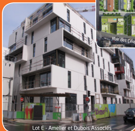
Lot E - Ameller et Dubois Associés

Les bungalows de chantier qui occupent actuellement une partie du trottoir rue des Cévennes seront retirés une fois les travaux achevés.