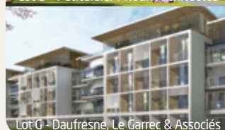
Lot G - Daufresne, Le Garrec & Associés