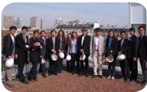
Visite avec la délégation Coréenne le 1 er avril

La ZAC Boucicaut a été visitée le 1 er avril dernier par une délégation venue de Corée du Sud et le 16 mai par une délégation du Danemark. Ces professionnels de l'aménagement et de l'immobilier ont souhaité découvrir un des projets phares de Paris, afin de connaître les pratiques françaises notamment sur les thèmes du Développement Durable et de la Biodiversité, pour laquelle Boucicaut a été désignée opération pilote par la Ville de Paris.